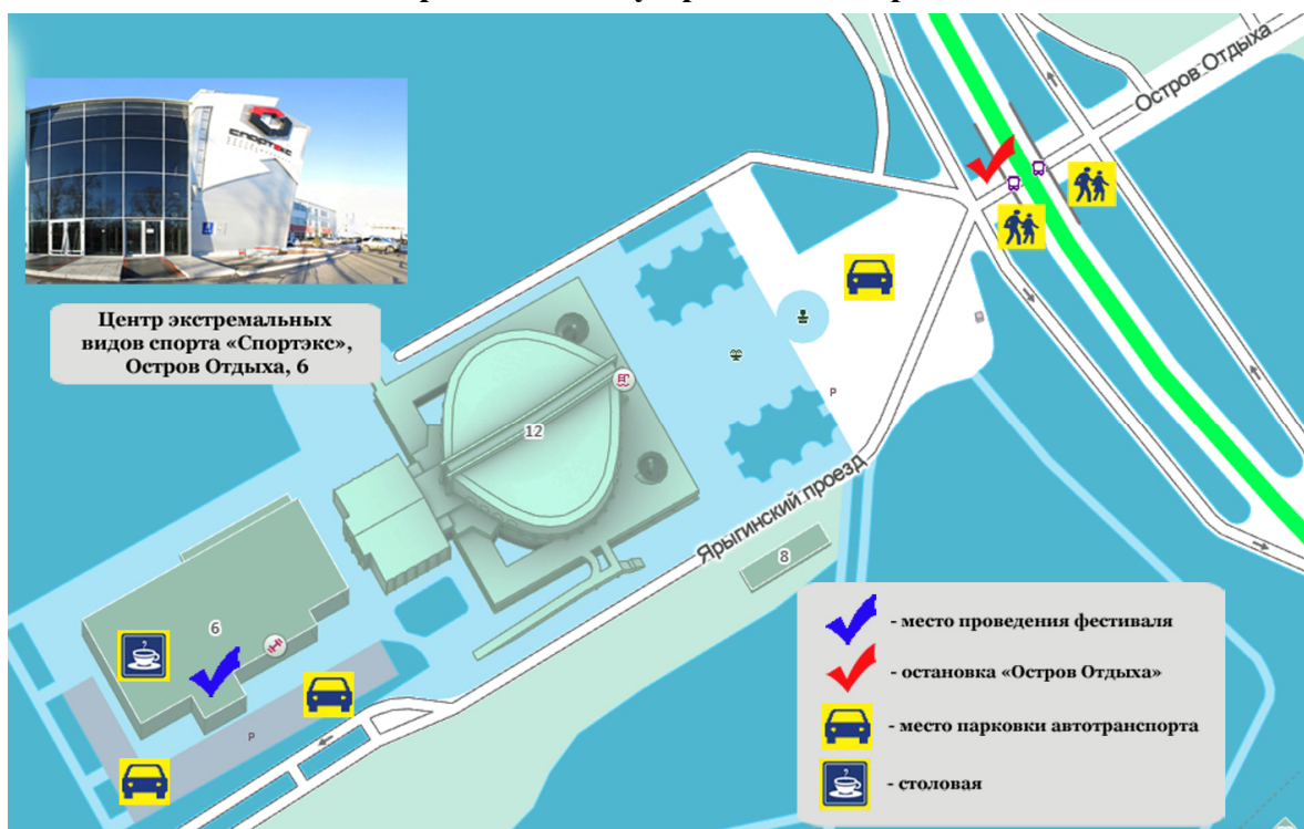
Схема проезда к месту проведения соревнований

Основная страница мероприятия в Интернете: